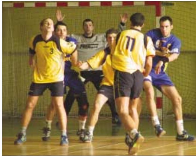
Konec prázdnin v kopřivnickém klubu házené pravidelně patří tradičnímu turnaji „O pohár Tatra, a. s.“