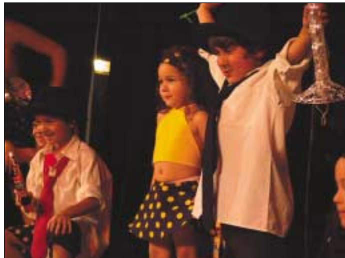
Motýlek přináší už devět let mnoho radosti divákům i účinkujícím.

Lesk kopřivnické taneční soutěži dodává především bohatý doprovodný program. Mezi jednotlivými částmi soutěžení párů v latinskoamerických a standardních tancích se na parketu prezentují také plesové formace, špičková čísla tanečních exhibicí a také netradiční disciplíny související s tancem a estetickým pohybem.