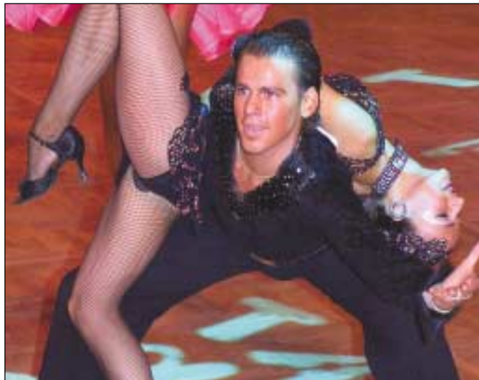
Soutěž TATRA do města každoročně přivádí špičkový sportovní tanec.