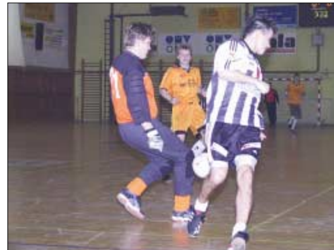
Novoroční turnaj v malé kopané bude patřit k prvním sportovním akcím roku 2005.