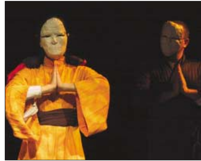
Přehlídka netradičního divadla KOPŘIVA patří k tradičním akcím kulturního kalendáře ve městě.