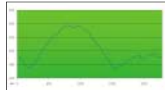
Výškový rozdíl jednotlivých cyklostezek zobrazených na mapě.