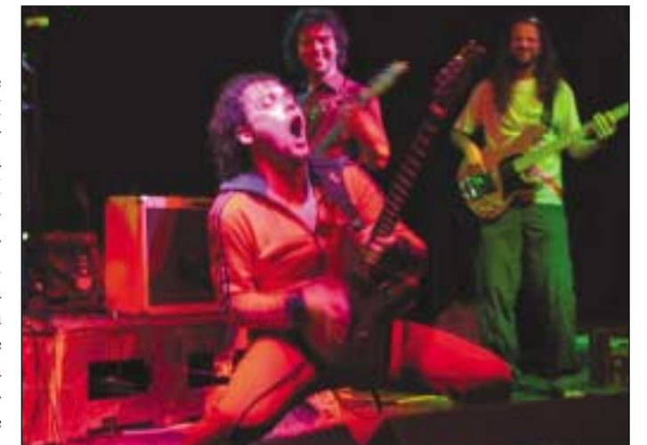
Centrem hudební alternativy ve městě je Nora Café.

například i November 2nd, nově vzniklý Umakart, nebo pražští Tata Bojs, jež spojuje dohromady to, že právě v Kopřivnici vznikla část jejich repertoáru. Součástí programové nabídky klubu navštěvovaného především mladými, jsou také divadelní večer, autorská čtení, videoprojekce a besedy. Tradiční je také letní open air festival Bartness. Ten v druhé polovině prázdnin navazuje na zaniklé Rockové šlahouny. I festival ve své dramaturgii kombinuje známé kapely s produkcemi muzikantů z regionu.