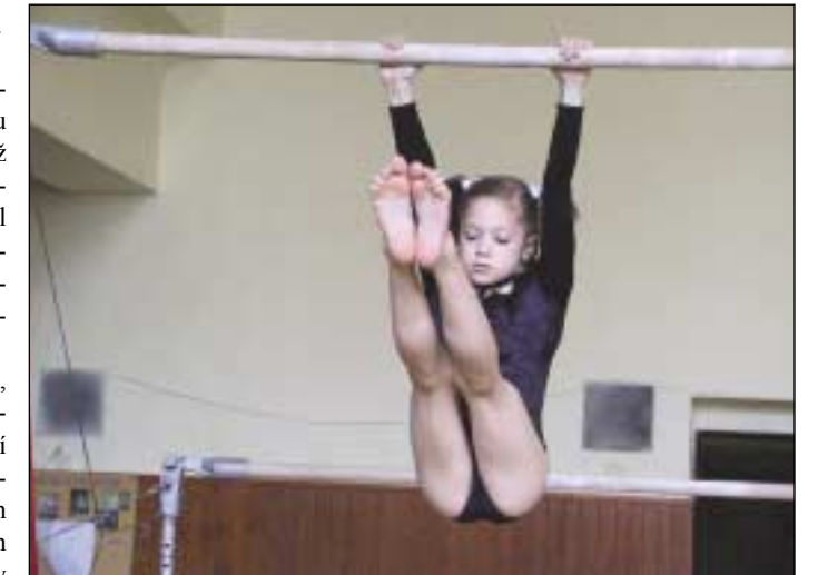
Prvním ze tří závodů bude v dubnu Velikonoční minitatar.